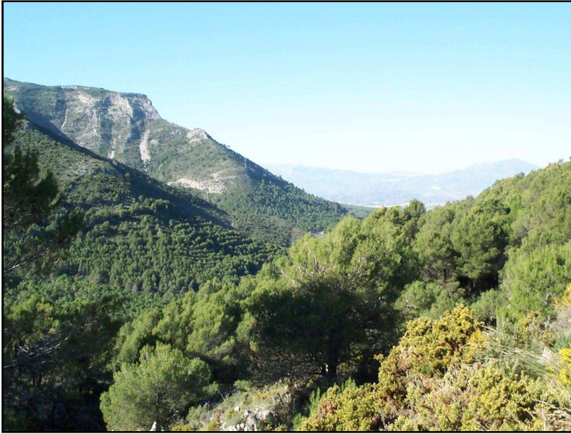
Subida a Jabalcuza desde Urbanización Los Tomillares

La situación de la Sierra de Mijas entre la costa y el valle del río Guadalhorce y a escasos 10 kilómetros de la capital malagueña ha dado a esta zona una afluencia de capital humano desde hace siglos, pudiendo remontarse las primeras ocupaciones humanas a pueblos pre romanos, tartesos o turdetanos y durante la época fenicia. Minas de plata, hierro y otros minerales; explotación de los montes con aprovechamiento de sus bosques de encinas y alcornoques, palmitos, algarrobas, espartos. En gran parte desaparecida esta vegetación y presente hoy en día el pino piñonero ( Pinus pinea ) y el pino carrasco ( Pinus halepensis ), después de las políticas de replantación de la década de los sesenta y setenta del pasado siglo.