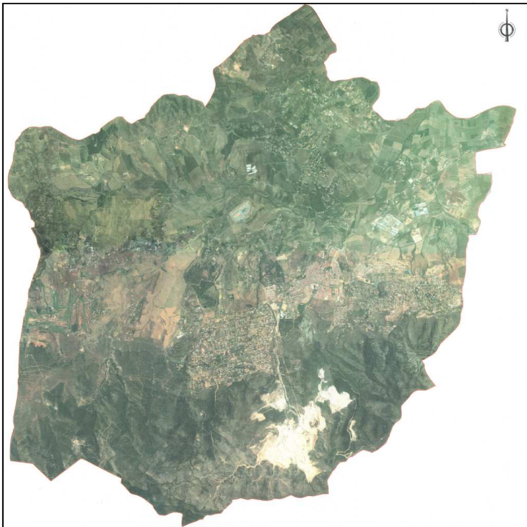
Alhaurín de la Torre 82,17 km2

Dentro del proyecto de la Gran Senda de Málaga que circunvala la provincia de Málaga a través de más de 650 km. de rutas senderistas del GR-249 tenemos que las Etapas 32, 33 y 34 discurren por la Sierra Mijas en los municipios de Mijas, Benalmádena y Alhaurín de la Torre.